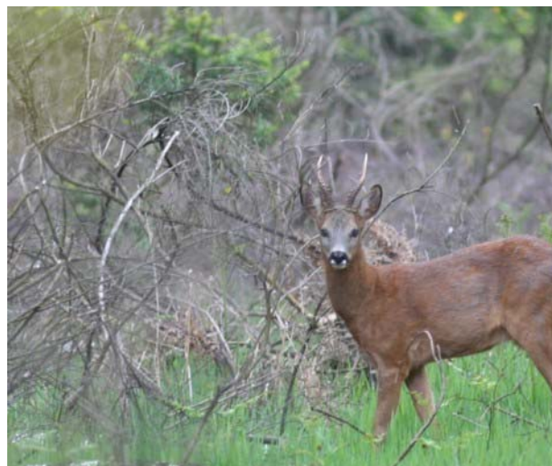
Au détour de chemins